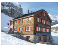
Lämmerenhütte SAC 2501m

Tel. Hütte: +41(0)33 744 33 39 www.wildstrubelhuette.ch