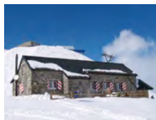
Cabannes Diablerets CAS 2485 m

Tel. Hütte: +41(0)24 492 21 02 www.cabane-diablerets.ch