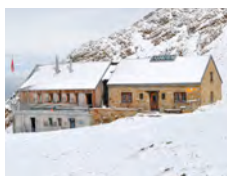
Wildstrubelhütte SAC 2791m

Tel. Hütte: +41(0)27 398 45 50 www.audannes.ch