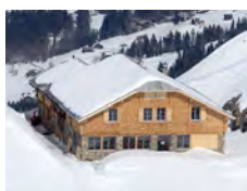
Geltenhütte SAC 2002 m

Tel. Hütte: +41(0)24 492 21 02 www.cabane-diablerets.ch