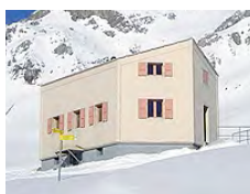
Cabannes des Audannes CAS 2508m

Tel. Hütte: +41(0)33 733 23 82 www.wildhornhuette.ch