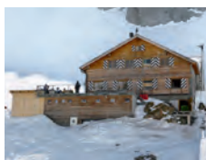
Wildhornhütte SAC 2304 m

Tel. Hütte: +41(0)33 765 32 20 www.geltenhuette.ch